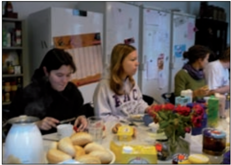
Stärkung vor dem Hausputz.