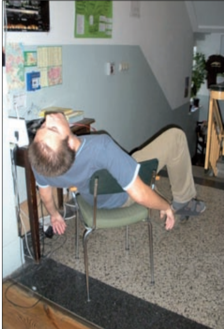
Studienhaus kann auch anstrengend sein.