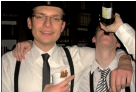
Gefeiert wurde auch kräftig.