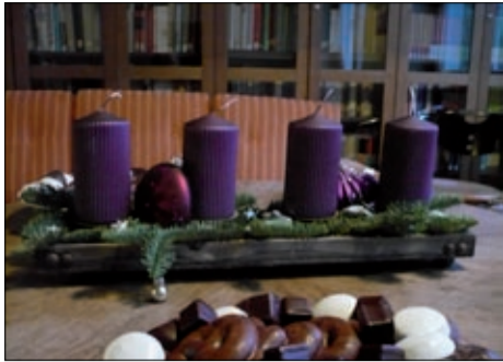
Advent im Studienhaus.