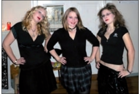
Die drei Grazien?!