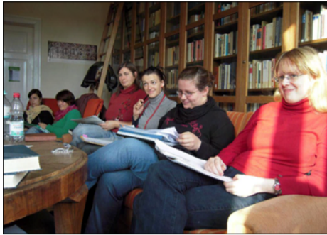
Hausübung: Feministische Theologie.