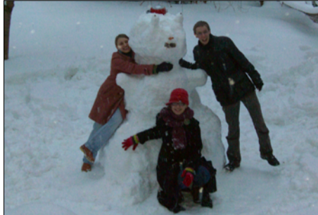
Schneemannbauen im Garten.