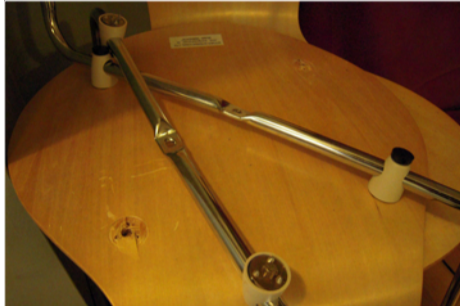
Stühle nicht für die Ewigkeit.