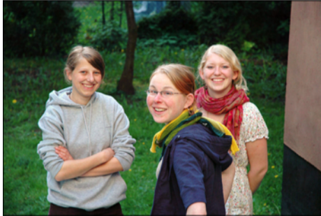
Plaudern beim Hornfischgrillen.