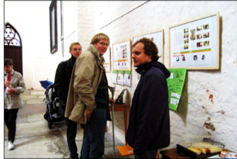
Perspektivtag in der Marienkirche.